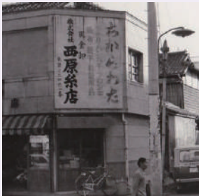
昭和の西原糸店の店舗写真